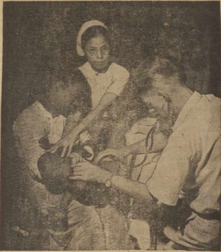
Jungtinių Tautų tarptautinis Vaikų fondas įrengė du tūkstančių vaikų - motinų kliniką Azijoje. Čia rodo gydytoją, kurs peržiūri jauną ligonį Rangoon klinikoje.