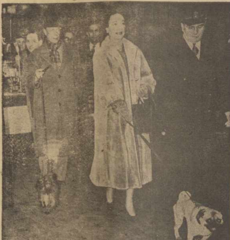
Kunigaikščiai Windsor, pasakė reporteriams, kad nedalyvaus karalienės Elzbietos II karinacijoje, birželio 2-trą dieną, nes būtų priešinga konstitucijai, jei dalyvautų bile valstybės esantis ar buvęs karalius.

Kitų laisvojo pasaulio kraštų lietuviai dar prieš metą pradėjo organizacinį darbą apsiungimo įkurdindami lietuviškas bendruomenes. Mes, amerikiečiai, didžiausioji mūsų išeivijos dalis, neatšilikame nuo kitų kraštų lietuvių sąjūdžio, mes tikimės, kad mūsų didžioji išeivija neužilgio pasijudins ir išvystys spontanišką sąjūdį per lietuviškas bendruomenes, tuomet trumfuos lietuvių vienybė užsienių kraštuose ir stiprės lietuvių kova už laisvę senosios tėvynės Lietuvos bei išsaugojimą mūsų tautinio ir kultūrinio gyvenimo užsienyje. Šis metas bus lietuviškųjų bendruomenių organizacinio darbo METAS, tatai svarbu, kad visų lietuviškųjų kolonijų lietuvių nedelstų, kad kogeičiau apsiungtų įkurdindami lietuviškas bendruomenes ir siektų išvystymo spontaniško lietuviško sąjūdžio Amerikoje.