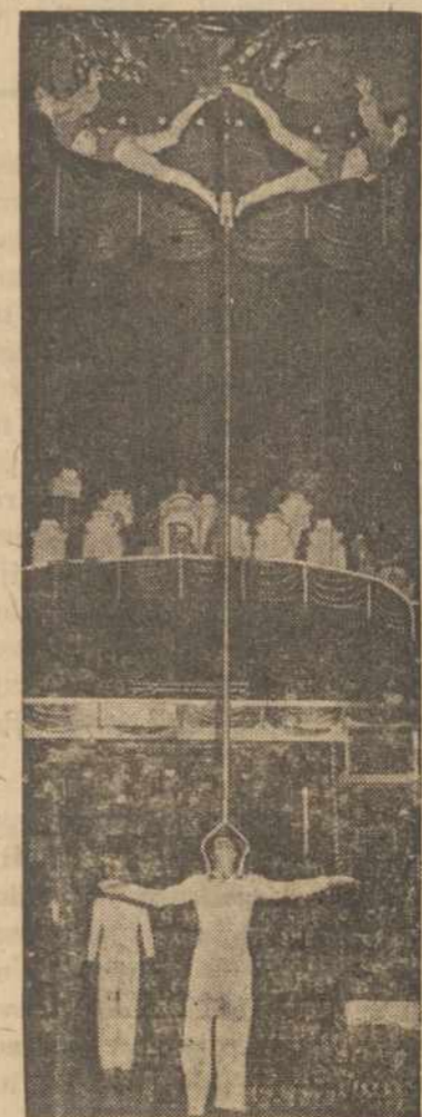
FOUR VAMEDILS Sensational European Perch Act appearing at Annual Charity Circus, Worcester Auditorium, January 18-24