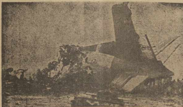
MOSES LAKE, Wash. — Čia C-124 Globemaster lėktuvas nukrito ir sudegė su 134 kariais, vykstančiais namo.