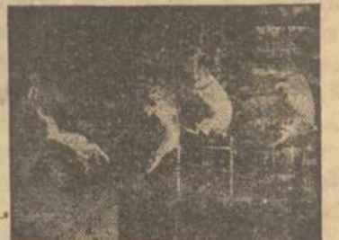
JOHN LADDIE & COMPANY Dog Comedy Bits

FUN FOR YOUNG AND OLD, GREATEST ALL-STAR INDOOR CIRCUS