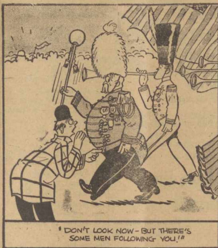
"Nežiūrėkite dabar—bet daug vyrų seka paskui Jus!"

Po to Gelvainio pulkai pradėjo tikrą plėšimo ir naikinimo darbą prieš žemėje be jokio pasigallė-