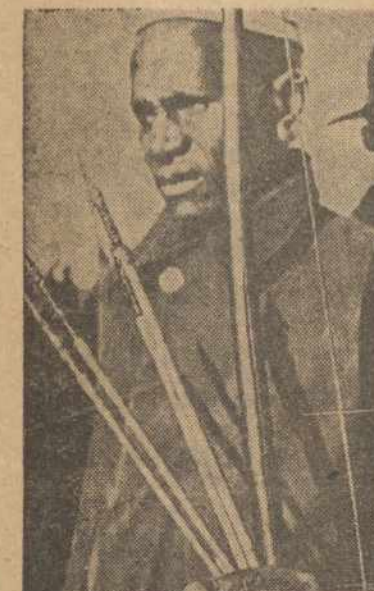
Afrikoj — Policininkas laiko Mau Mau teroristų ginklus.

Memorandumo išvadoje pabrėžiama, kad Maskvos valdovai savo agresinius veiksmus visada stengiasi apvilkti legalumo šydu ir auką vadinti užpuoliku. Pirmenama, kad Sovietų Sąjungai jau Tautų Sąjungoje buvo pripažinta agresoriumi prieš Suomiją ir dėl to buvo pašalinta iš Tautų Sąjungos. Be to, nurodomas panašus pavyzdys iš Austrijos prie Vokietijos prijungimo. Šis prijungimas irgi buvo stengiamasi nušviesti kaip "savanoriškas" prisijungimas, tačiau Nuernbergo teisme buvo aiškiai pasisakyta, kad, "jeigu net tai būtų ir tiesa", tai yra, jeigu net iš tiesų būtų gyventojų noro atsisakyti nepriklausomybės ir susijungti su kita valstybe, vistiek šitokiais būdais įvykdytas prijungimas, kaip buvo Austrija prie Vokietijos prijungta, yra agresija O Lietuva irgi buvo panašiai "savanoriškai" prijungta, tai yra, tik pačiam užpuolėjui tą neva "savanoriškumą" stengiantis parodyti.