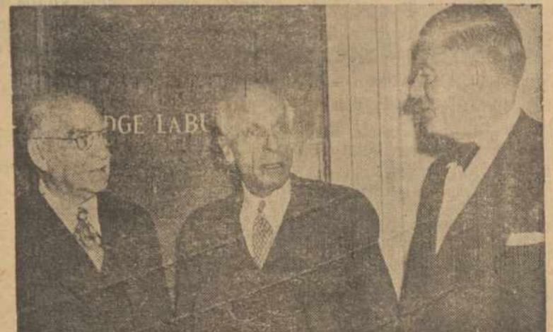
CHICAGO, ILL. — Vyriausybė užvedė teismą prieš Du Pont de Nemours & Co. trustą, 1949 metais ir dar nebaigtas.

Lietuvių reikalai ir Lietuvos išsilaisvinimo byla žinoma taip pat naujamam viceprez. senat. Nixonui. Vasario 16 d. proga jis yra lietuviams pareiškęs, kad jo žvilgsnis yra nukrypęs į tuos laikus, kai Lietuva su kitais pavergtais kraštais ir vėl bus laisva. Dabar JAV busimasis prezidentas yra tapęs viso laisvojo pasaulio vairininku.