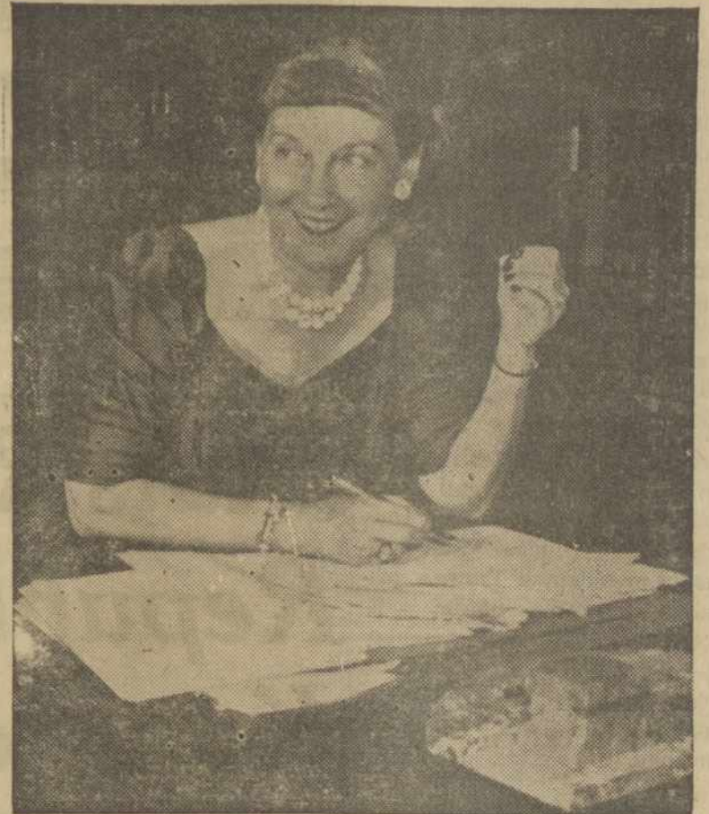
PONIA DWIGHT D. EISENHOWER, visų vadinama "Mamie", bus Baltųjų Namų šeimininkė. Sulaukusi 19 metų, ji susipažino su generolu, tada jaunu leitenantu, Sam Houston forte, Texas, ir juodu pasivedė 1916 metais. Bėgy sekantių 36 metų, ji turėjo savo namus perkelti apie dvidešimt penkis kartus, kada jos vyras buvo paskirtas iš vienos armijos tarnybos į kitą. Per varginančią rinkiminę kampaniją pasisakė, kad jos didžiausias rūpestis buvo prižiūrėti savo vyro sveikatą.

Šie namai jau įeina į gyvenimą ir ten randa prieglobstį įvairūs jaunimo pasirodymai, paskaitos, skautų veikla, iškil-