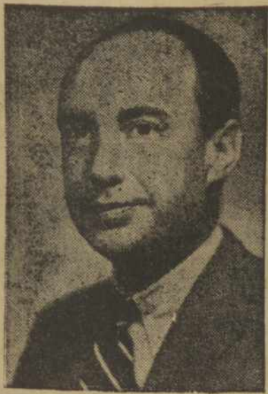
ADLAI E. STEVENSON