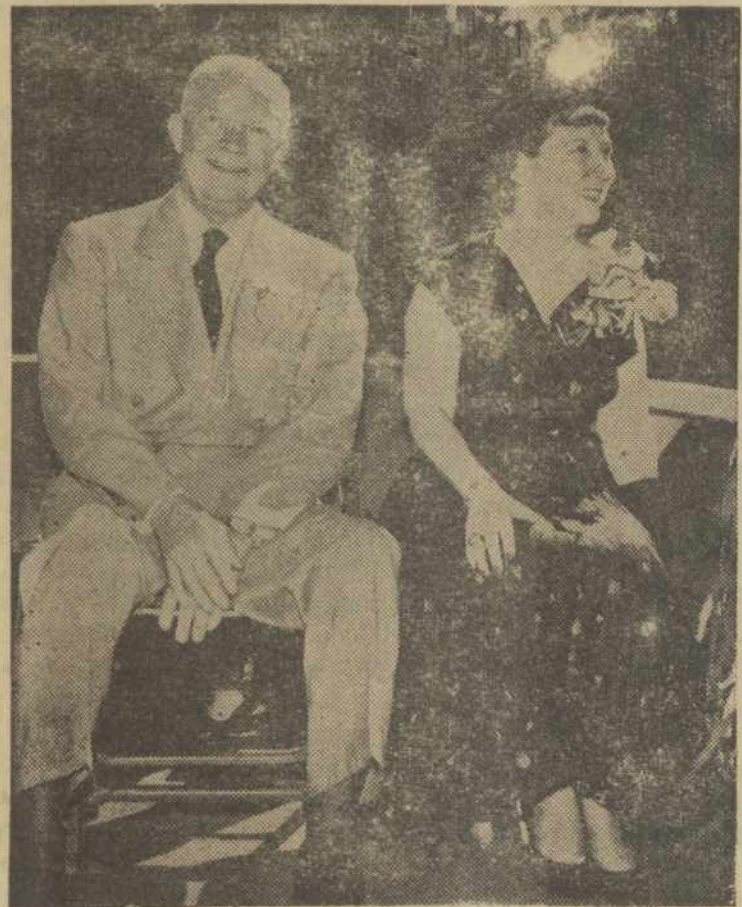
DWIGHT D. EISENHOWER su savo žmona "Mamie", paskutinėse dienose prieš rinkimus.

Nors aršiai viena su kita kovodamos partijos vis delto pajėgė apsaugoti nuo kokios trečios didelės partijos įsisteigimo, kuri pajėgtų išstatyti savo kandidatą prezidento rinkimams ar turėtų kitą didesnę įtaką. Kartais katra kita partija atrodė įgaunanti kiek daugiau reikšmės bet nė viena iš jų nepajėgė išsilaikyti. Viena tokių tai Teodoro Roosevelto 1912 m. Pažangiųjų partija, surinkusi milijonų balsų daugiau negu William Howard Tafto respublikonų partija.