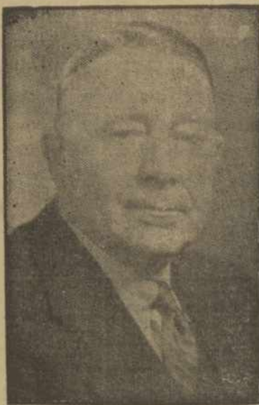
(County Commissioner) Republikonas

Penkiolika Metų Atholio Vaizbos Buto Pirmininkas. Devynis Metus Selektmono Tarybos narys. Buves Valstybės Selektmonų Sąjungos Tarybos narys. Buves Atholio Racionavimo Pirmininkas. Tris metus Atholio Finansų Taryboj.