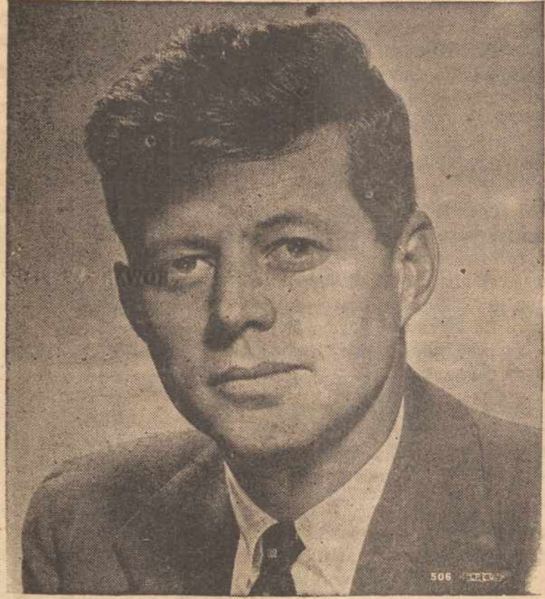
CONG. JOHN F. KENNEDY

“Balsuokite Už KENNEDY Kurs Balsavo Už Jus!” JOHN F. KENNEDY - 1 - Jungtinių Valstybių Senata