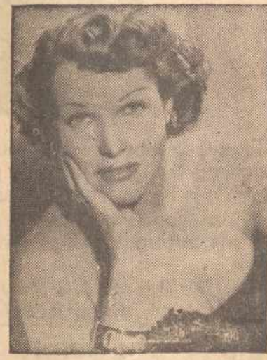
HILDE GUEDEN, Metropolitan Operos Sopranas.

MUZIKOS FESTIVALIS Spalio 20-25, Worc. Auditorium