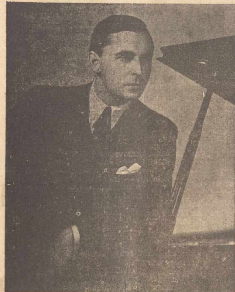
RULOLPH FIRKUSNY, pianistas Muzikos Festivalis laike Spalio 20-25 dienomis, Worc. Auditorium.

Vaistinės valandos: nuo 9 ryto iki 10 vakaro Sėkmadieniais: nuo 9 ryto iki 9 vakaro Čia irgi parsiduoda lietuviški laikraščiai