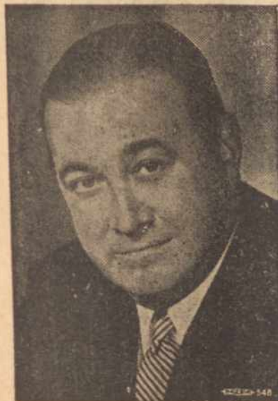
GUB. PAUL A. DEVER