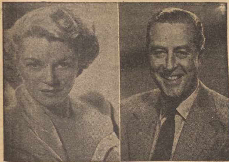
Hollywoodo žvaigždės, CLARE TREVOR ir RAY MILLAND svečiai Amerikos Kepėjų Sąjungos seime, spalio 19, Chicagoj.