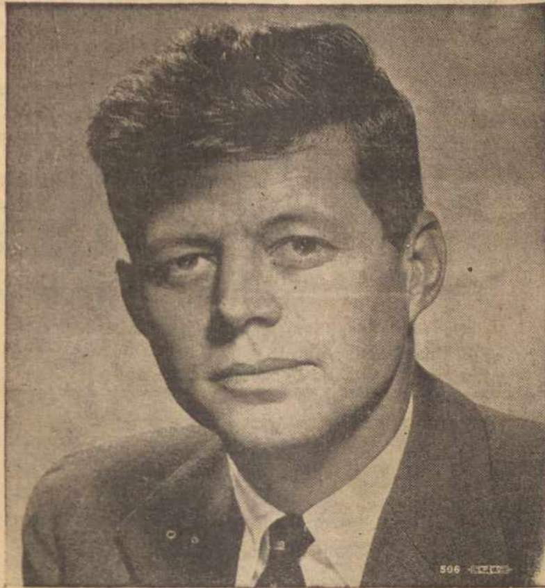
CONG. JOHN F. KENNEDY