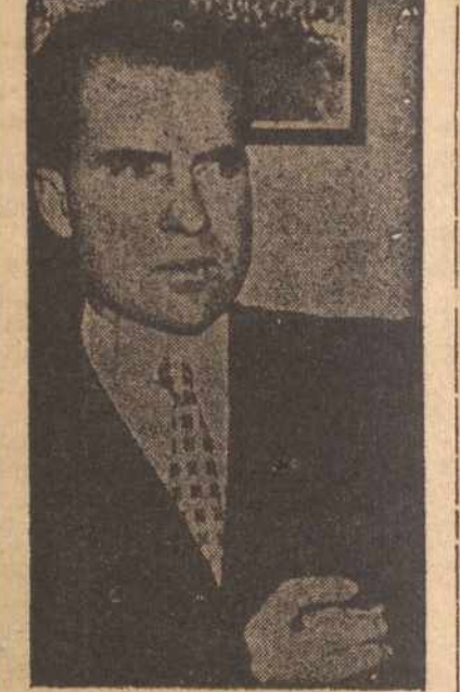
SENAT. RICHARD NIXON repub. kand. į vice-prezidentus varo smarkią kampaniją prieš rinkimus.

kand. "Sutinku su jūsų nuomone, dabar suprantu prasmę "giminingumo", bet aš nebuvau newdealeris ir fairdealeris, nejučiu, jog esu giminingas Stalinui". Aš atsakiau jam: "Puiku! Aš džiaugiuosi jūsų samprotavimu ir nusistatymu, spėju, kad šiais rinkimais bus daugiau tokių kai tamsta". Taip baigėsi mūsų korespondencija "dėdės" klausime.