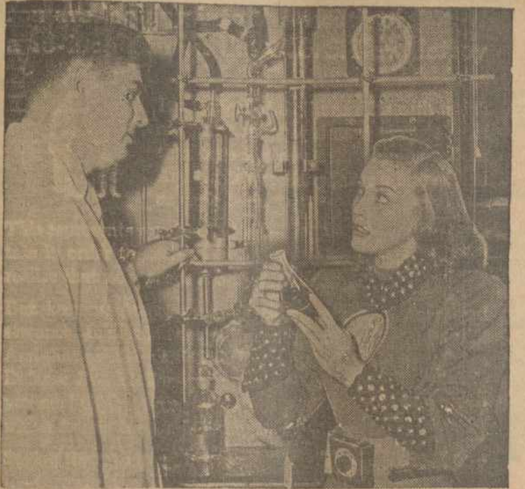
Televizijos artistė ABC — TV programoje aplankė Lederle Laboratorijas, kur išrasta daug svarbių vaistų.