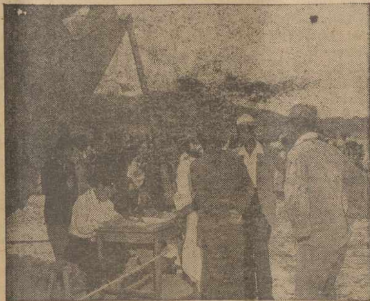
Šitas senyvas koriejietis yra vienas iš kelių šimtų, kuriuos Korėjos respublika su pagelba Jungt. Tautų apgyvendina ir tūkst. akrų žemės bus sunaudoti vėl sodinimui.