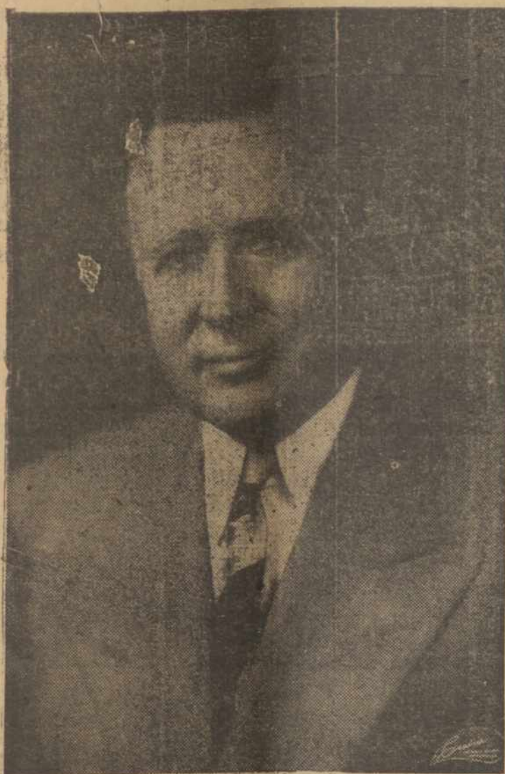
ARTHUR E. SUMMERFIELD Republikonų Tautinio Komiteto Pirmininkas

Šiandien Vokietija stovi prie "kujo ir priekalo". Jai grėsia pavojus Korėjos likimo, Rusai okupavo arti net pusę Vokietijos. Nesitrauks iš jos, nes jų tikslas valdyti Vokietiją ir vėliaus visą Europą. Rusijos pozicija (geografiniu ir militarinėmis strategos atžvilgiu) labai gera, o jos oponentų bloga, todėl Stalinas nedaro jokių kompromisų oponentams ir vokiečiams. Ir jei nebus pasidalinta "vokišku kaulu", aišku, kad nebus taikos patikrinimo Vokietijai ir Europai. Mūsų samprotavimu, Kremliaus valdovai žinodami vakarų demokratijų politinį ir moralinį bankrutą, jų silpnības, ateityje pasielgs taip kaip Hitleris elgėsi, puls vakarų Europą maskoliai visomis savo ir jų talkininkų — satelitų jėgomis. Tokių davinį visis laukiam iš didžiųjų valstybių vadų politikos, tikriaus sakant, rusų imperializmo politikos.