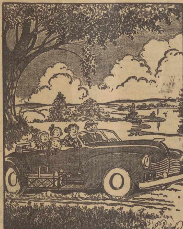
Važiuojam į Pikniką

— "Amerikos Balsas" lenkų valandėlėje šiomis dienomis kalbėjo apie Vilnių, kaip lenkų miestą. Argi JAV duoda lenkams valandėles kiršinti tarp savęs tautoms?