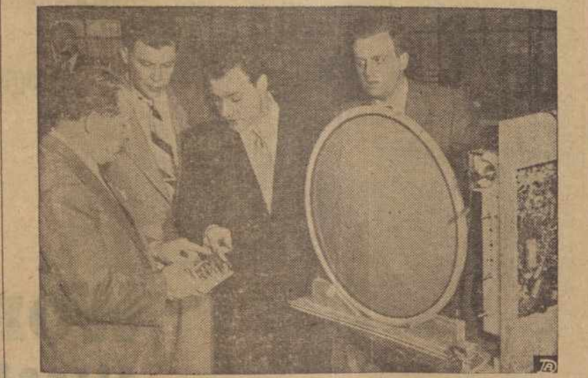
Vaizdas Tele - King korporacijos kompanijoje, kuri išdirba elektroniškus įrengimus krašto militariškos apsaugos programai