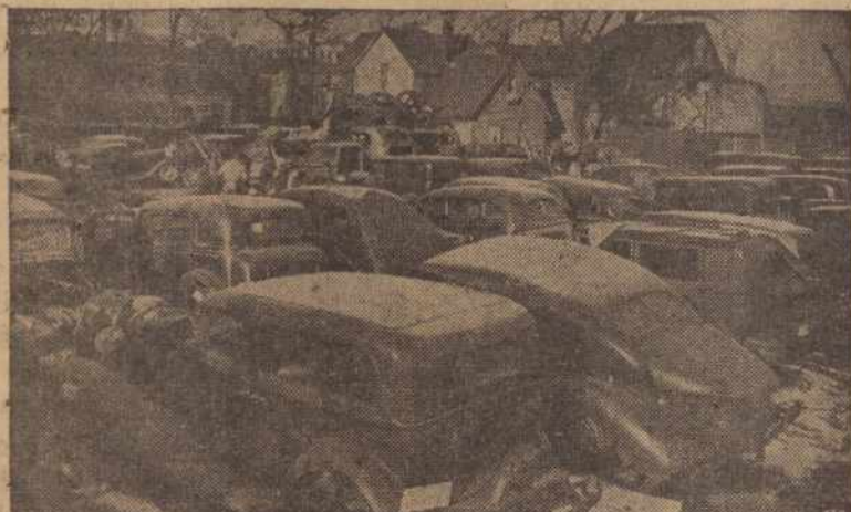
Automobiliai laukia mekano