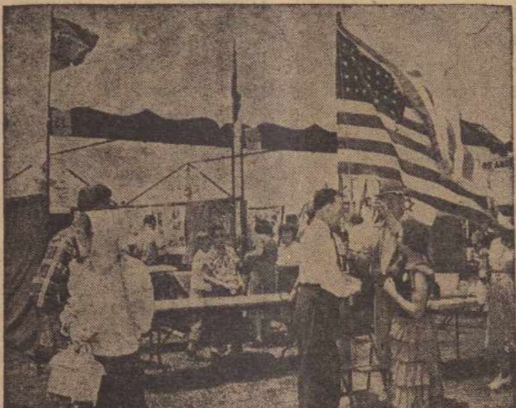
LOS ANGELES, Californijoje, laike metinės Pasaulinės Pramonės savaitės parodos, žmonės išmetė komunistų propogandą, pastatė Jungt. Valst. vėliavą.

Kur įstvirtina komunistai, ten baigiasi žmonių laisvės dienos. Žmonės, labiau brangydami laisvę negu savo turtus, palieka juos ir bėga nuo to laisvės prieš komunistų.