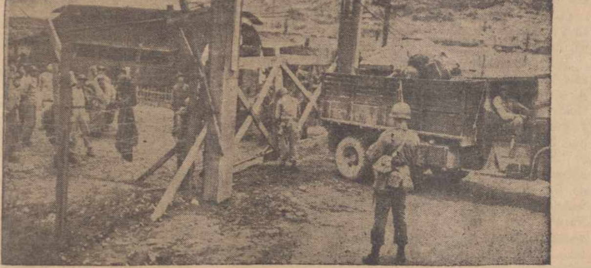
KOJE SALA, KOREJA. — Jungtinių Valstybių sunkvežimis sustojo prie vartų pristatyt maisto karo belaisviams komunistams. Belaisviai patys įsineša ir pasigamina.