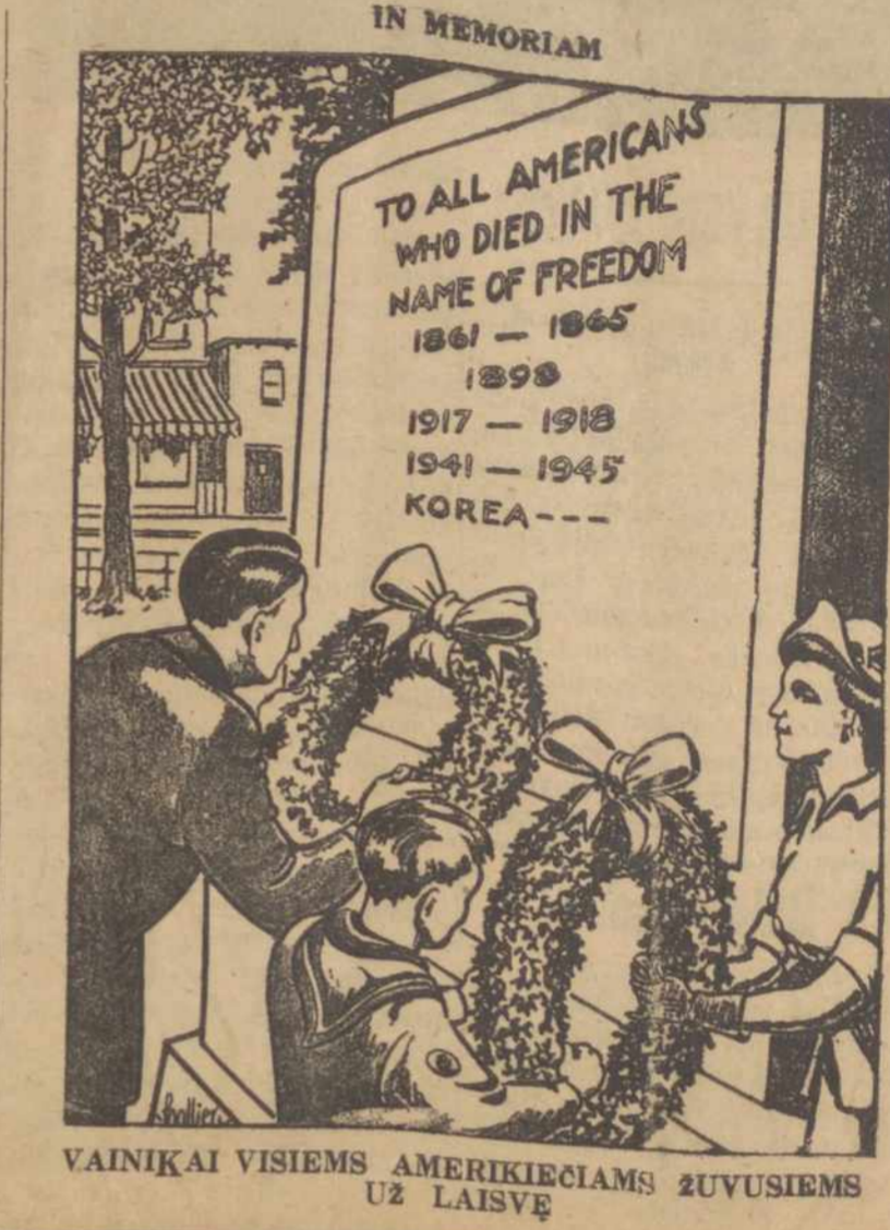
VAINIKAI VISIEMS AMERIKIECIAMS ŽUVUSIEMS UŽ LAISVĘ

Armija pažadėjo visus tris paminėtus generolus gražinti į Jungt. Valstybes, kur jie turės būti klausinėjami Senato Kariškų Pajėgų Tarnybos komitete.