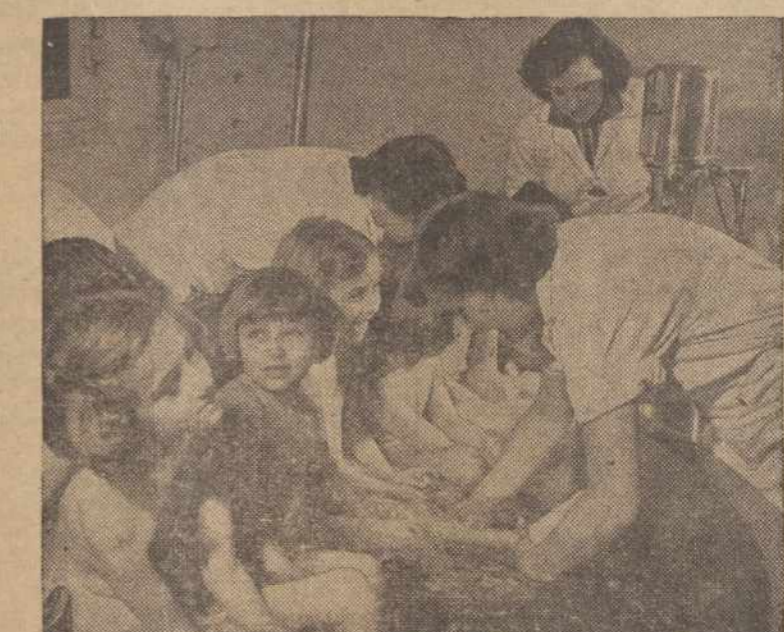
Ne visi vaikučiai laksto, daug jų paralizuoti gydomi ligoninėse