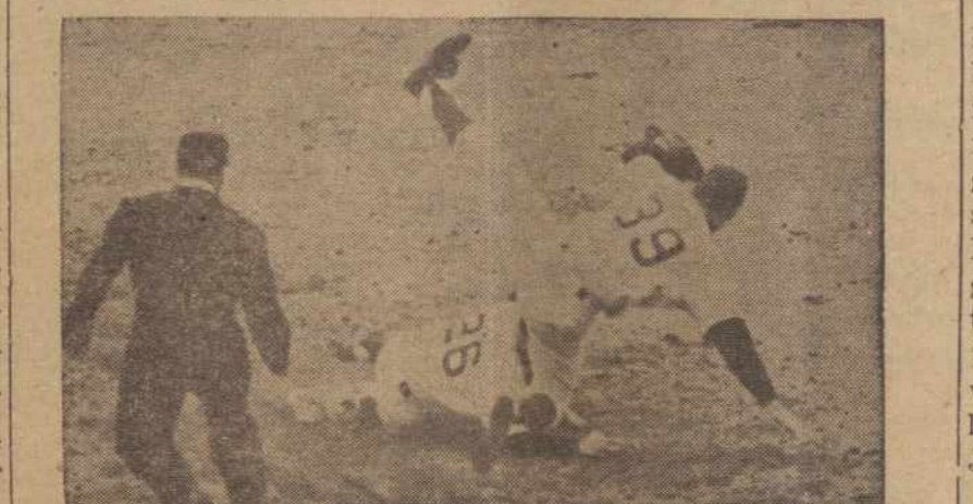
Beisbolo Sezonas Prasidėjo Vėl

Išleido "Lietuvių Dienų" leidykla, Los Angeles, Kalifornija. 180 puslapių. Idomi pasaka apie našlaičio Rapoliuko gyvenimą tarp svetimųjų ir kaip jis rado prietelių ir pagaliau nuolatinius namus ir gerą globą.