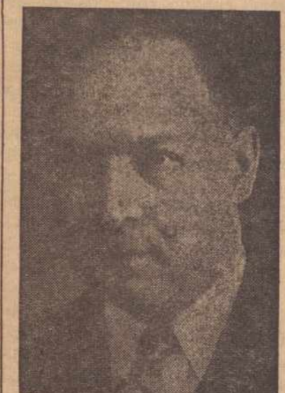
Kad būtų sutaupta daug pinigų ir laiko SLA narių naudai,