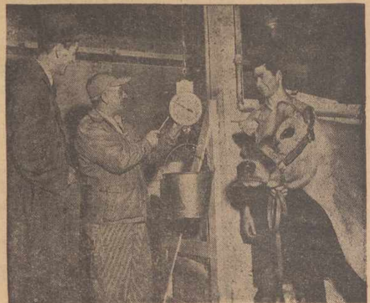
Sioji Opal Crystal Lady, Jersey karvutė nustatė naują rekordą; Langlois miestely, Oregon valstijoje.