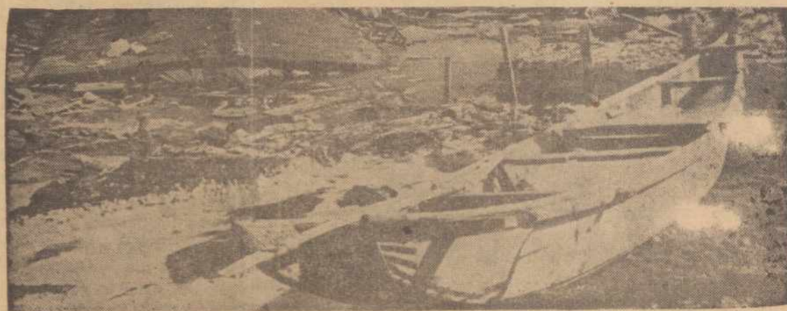
KIRITAPPU, Japonija. — Vaizdas Kiritappu, po teriojančio žemės drebėjimo. Virš 35 žmonės buvo užmušti, gi daug daugiau sužeisti, dingusių ir tūkstančiai be namų. Šiam miesteliui teko daugiausia nuostolių.