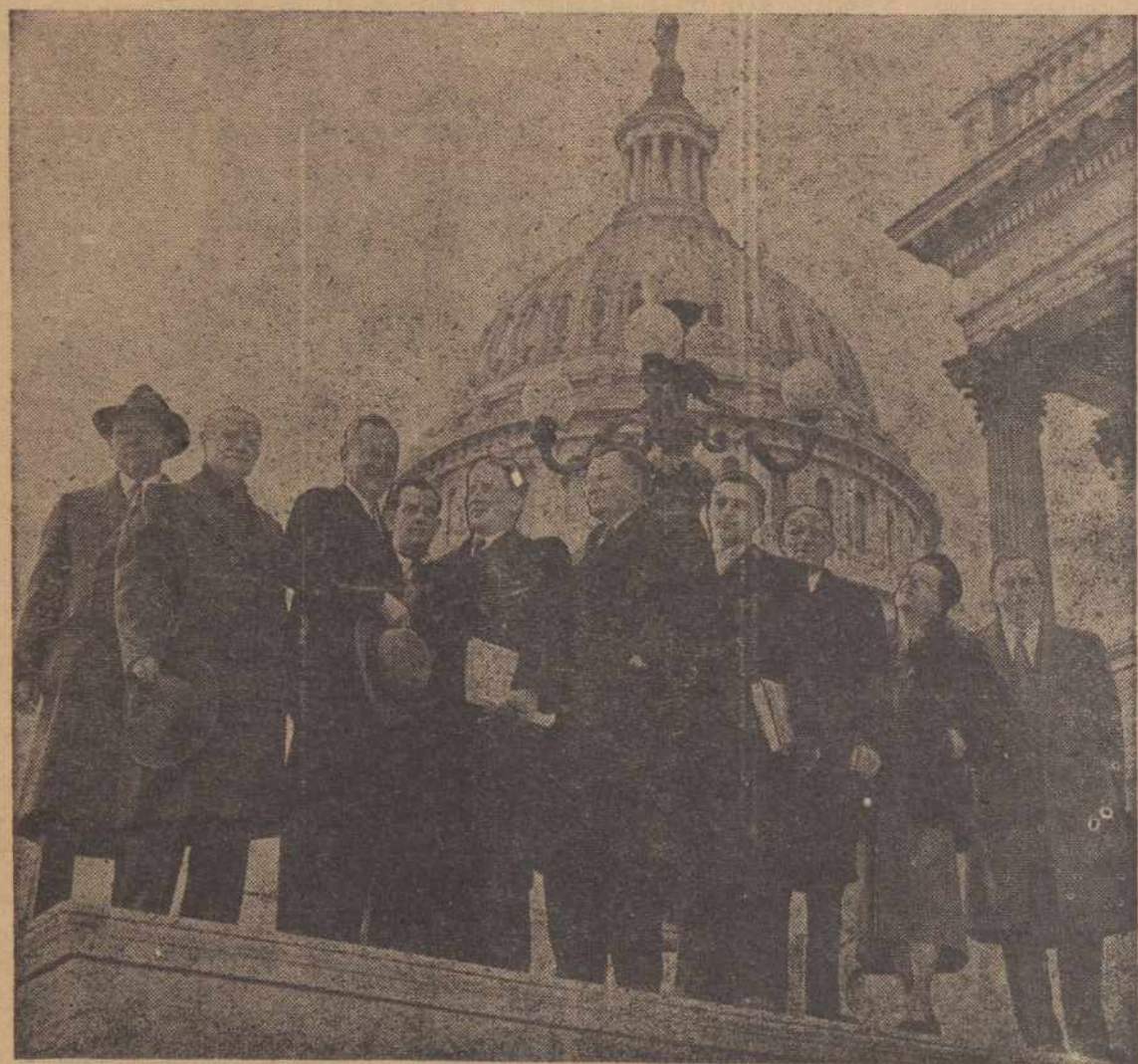
Vasario mėn. 15 d., kai ALT. Delegacija lankėsi pas Prezidentą Trumaną, trys iš Lietuvos pabėgę žvejai irgi buvo atvykę į Washingtoną, kur buvo priimti kai kurių senatorių.