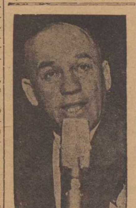
Washington, Henry Grunwald, buvo pašauktas Kongreso, kaip liudininkas del taksų skandalų.