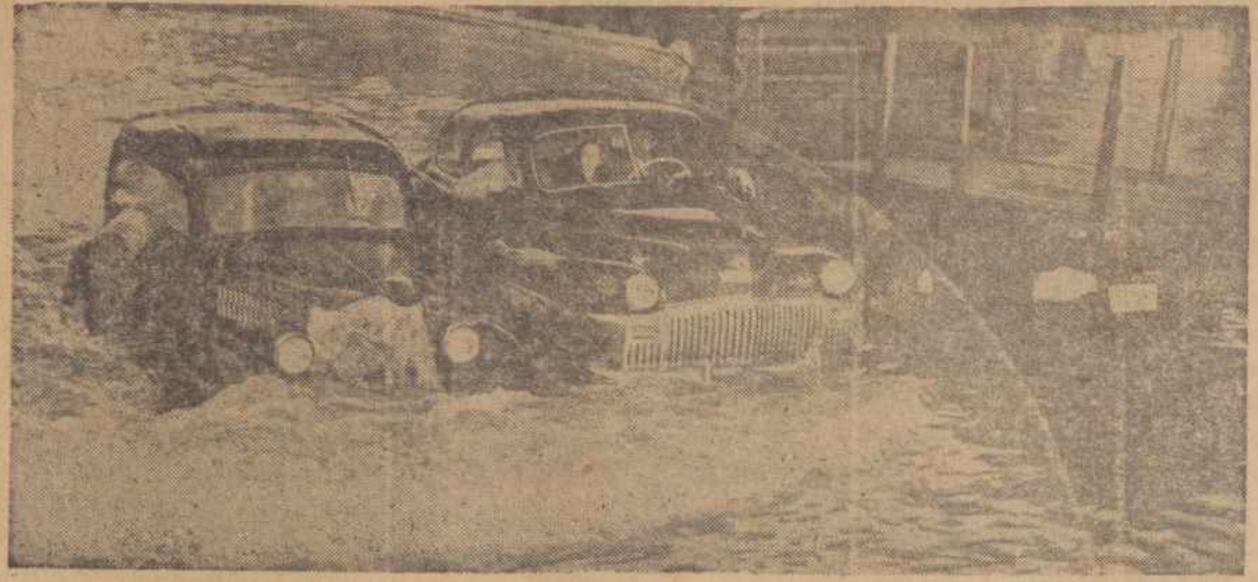
MARIETTA, OHIO. — Vairuotojai bando važuoti per gilų vandenį, išvykdami iš miesto, kada Ohio upė apsėmė kelius.