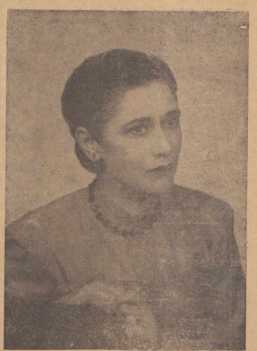
KONGRESO ATSTOVĖ (N. Y.) EDNA F. KELLY, lietuvių bičiulė, kuri dalyvavo ir pasakė kalbą vasario mėn. 17 d. New Yorko Lietuvių Tarybos rengiamame Lietuvos Nepriklausomybės sukakties minėjime.