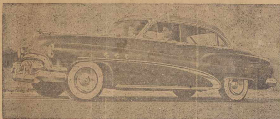
Buick'o naujas keturių durų automobilis, vidutinio brangumo, su visais patogumais, F263 inžinu, ir su vėliausiais apsaugos įtaisymais.

mo užsiėmimo, tiek tėvai ribotas kiekis. Knyga, kai besiruošiantieji vaikus siųs išeis bus pardavinėjama po ti į vienos ar kitos profesijos mokyklas. Pradedant daktarais, inžinieriais, advokatais, baigiant gailėstingosiomis seserimis, lakūnais, buhalteriais, kasininkais, knygvedžiais—visa eilė profesijų aprašyta ir suteiktos smulkios informacijos kaip į jas pakliūti, koks pasiruošimas reikalingas ir kur tuo reikalu kreiptis.