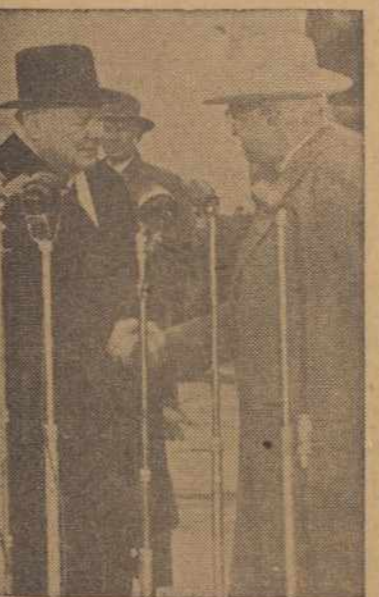
Washington, D. C. — Prezidentas Truman sutiko britų premierą Winston Churchill su svečio palydovais Washingtono orlaivų stoty. Jau Churchill grįžo į Angliją.