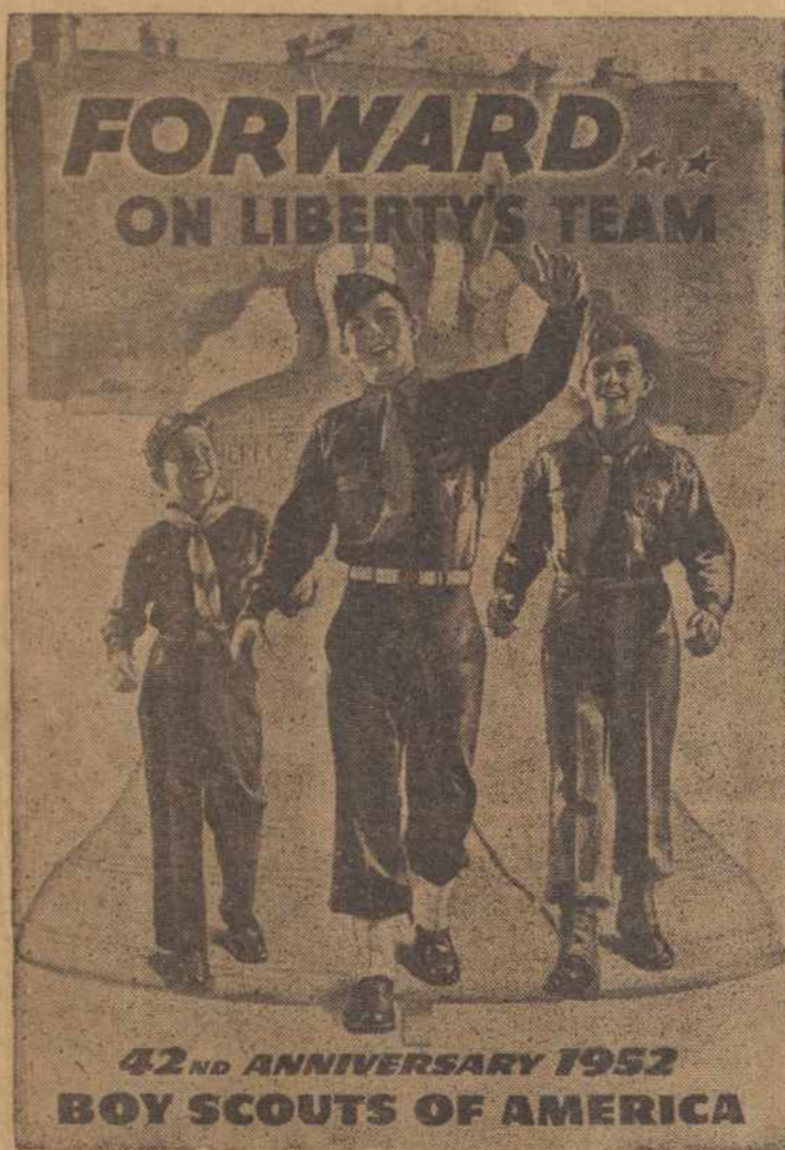
AMERIKOS BERNIKŲ SKAITAI RUŠIASI MINĖT SUKAKTUVES.

Tačiau daug tų pačių vokiečių, gerai pažįstančių tikrąjį bolševizmą, lygiai kaip ir tremtiniai, nėra tokie optimistiški ir netiki, jog bolševikai galėtų atsakyti savo senų imperialistinių tikslų. Ir tie bolševikų kėsłai tol grės pasaulio taikai, kol iš viso egzistuos maskvinė bolševikinė sistema.