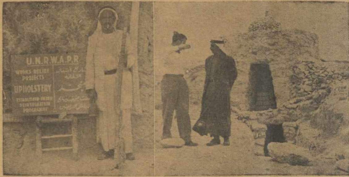
JUNGTINIŲ TAUTŲ PAGELBOS PROJEKTAS, TOLIMUOSE RYTUOSE.

Laiko vilkinimo žaidimas įgauna rimtėjimo pažimį. (Tąsa ant 6-to pusl.)