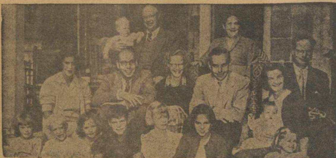
Murray Bay, Quebec. — Devyni anukai, trys sūnus ir trys marčios neseniai nusifotografavo su senatoriu ir poniu Robert A. Taft, kurs pernai pranešė, kad laikys kandidatūrą į prezidentus, republi. onų partijos.