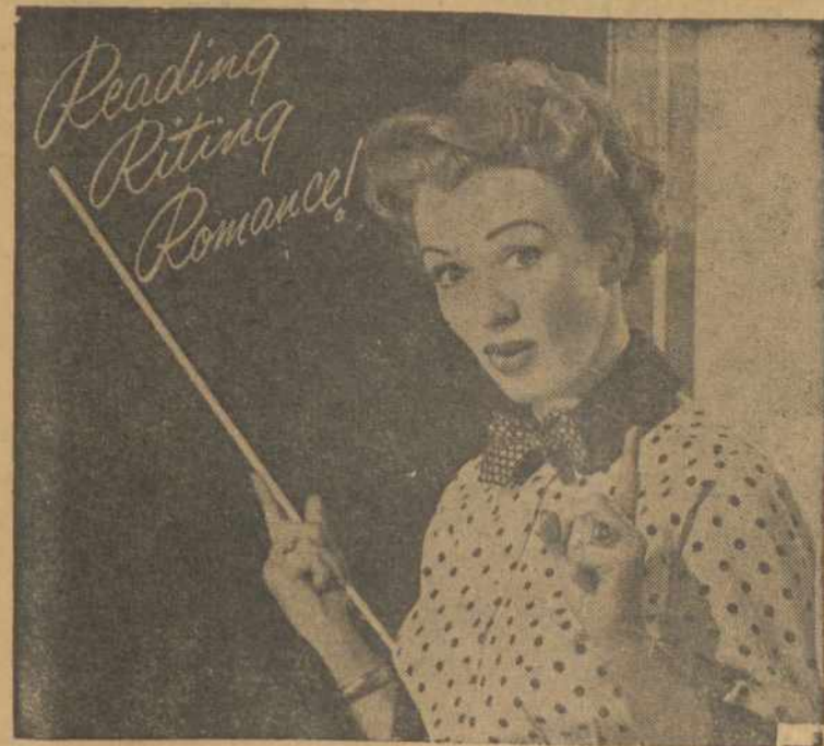
Žiemą tinkamiausias laikas mokytis, skaityti ir rašyti įvairiose kalbose.

— taip pat okupacinių komendantų polit. patarėjams ir generolams, kaip kad rodo ypač R. Vokietijos pavyzdys. Tačiau vis tiek visais politiniais klausimais paskutinis žodis gali gale priklausyti polit. biurui, kuriam pirminkauja pats Stalinas.