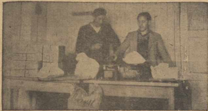
Lietuvių D.P. stovykos Vokietijoje džiovininkai ir kiti ligoniai gauna BALF'o jiems skirtas gerybes. Iš viso Vokietijoje dabar yra apie 2,500 lietuvių ligonių, kuriems pagalba būtinai reikalinga.