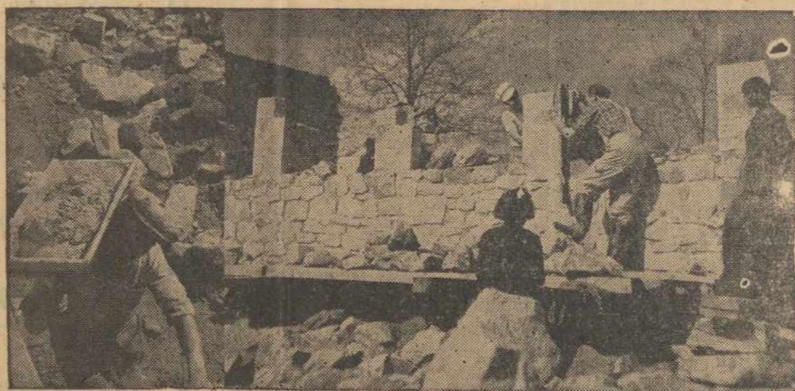
JUNGTINĖS TAUTOS stato naujus namus gyventojams Tolimuose Rytuose

Šioje kovoje — laimėti draugu, žmones — žmonėms, balionai skrieja per geležinę uždangą, galėtų būti lygiaverčiai Kaiserio aklinom traukiniui, kuris buvo priežastim revoliucijos ir 1917 m. Rusijos pasidavimo. (Pabaiga)