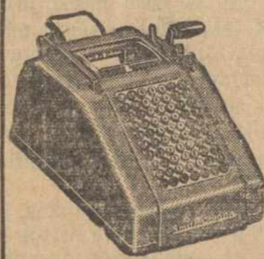
AMERIKOS LIETUVIS 14 Vernon St., Worcester

Please send corrected bill Embarrassing isn't it? Buy an inexpensive Smith-Corona adding machine and eliminate errors in your billing and bookkeeping.