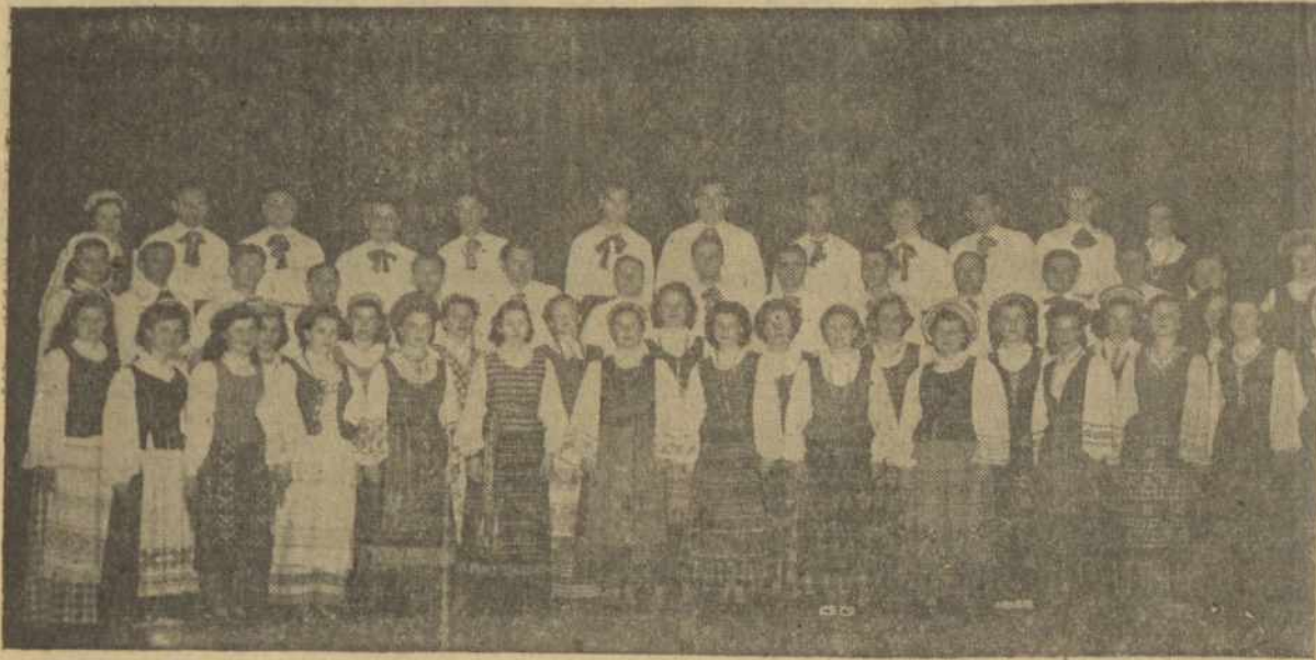
Didžiojo New Yorke tremtinių šalpos savaitėdidžiuli koncertu spalio 7 d. Pradžia 4 v. Programoj dalyvauti Vajaus Komiteto pakviesti lietuviai menininkai mielai sutiko savo tuis prisidėti pagalbei bendram darbui — paremti Vokietijoje likusiems lietuviams, ypač senligioniams, našlėms.