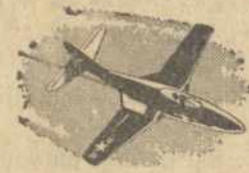
EVER THRILL to the sight of a sabre-winged jet fighter—out-racing the sound of its own engines as it knives through the summer sky?