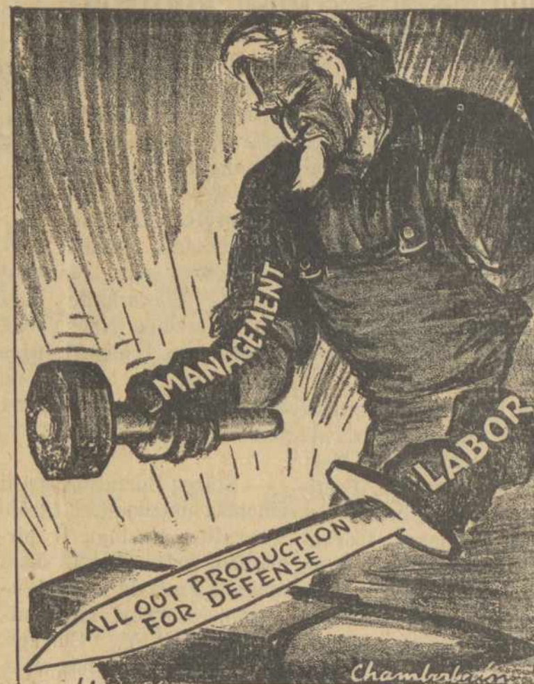
DARBDAVIAI ir DARBININKAI KALA APSIGYNYMUI GINKLUS

Bet rašydami į Vakarų Europą kitaip galime parašyti. "Amerikos darbininkai", tokie laisvai galėtų paminėti, "stovi su