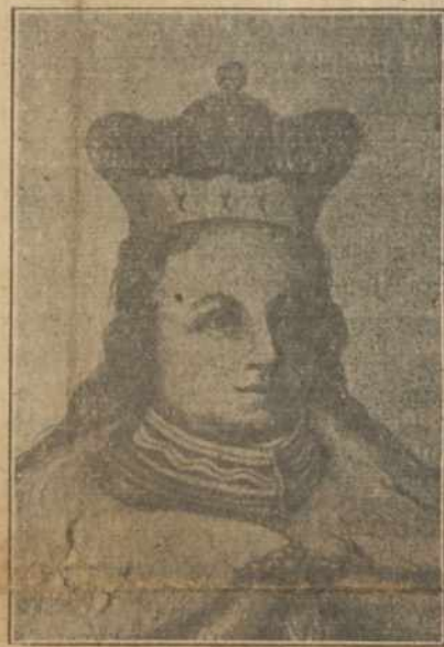
Didysis Lietuvos Kunigaikštis VYTAUTAS

1430 m. rugsėjo 8 d. Vytauto Didžiojo laikų Lietuva buvo pasiekusi aukščiausią savo galybės laikotarpį. Istorinėje Luchų pilyje, Vytauto sukviesti, suvažiavę visi žymiausi anų laikų Europos valdovai, Vokietijos ir Konstantinopolio imperatoriai, totorių Auksinės Ordos Chanai, daugybė įvairių šalių kunigaikštelių, didikų ir bajorų.