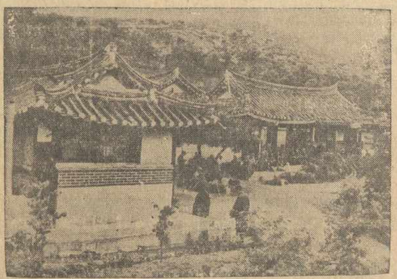
Jungtinių Tautų Namai, Kaesonge, Korėjoje, kur Taikos Konferencijos atsovai gyvena.

Spaudoje pradėjo reikštis dar spaudos draudimo laikais, bendradarbiavo "Varpė", "Ukininke", "Vilniaus Žiniuose".