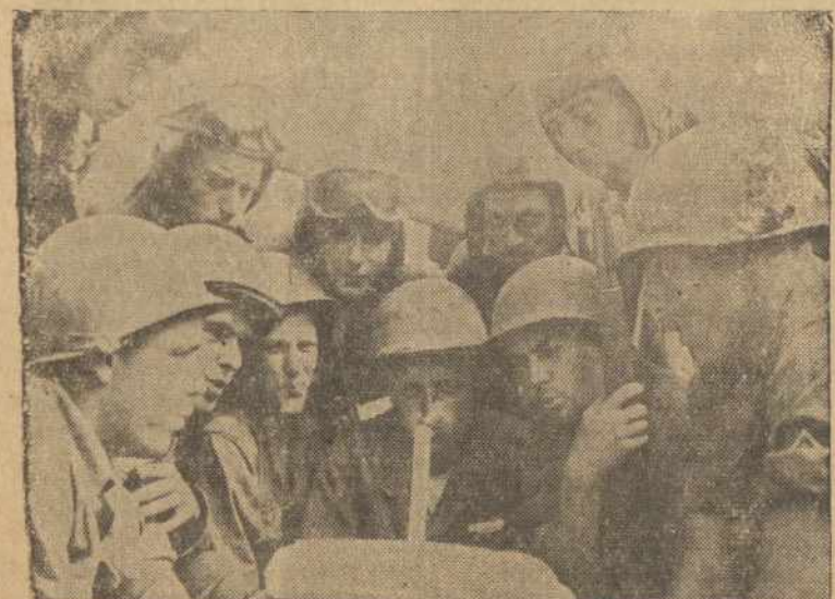
Kareiviai lavinasi, pratinasi naudoti įvairius pabuklus