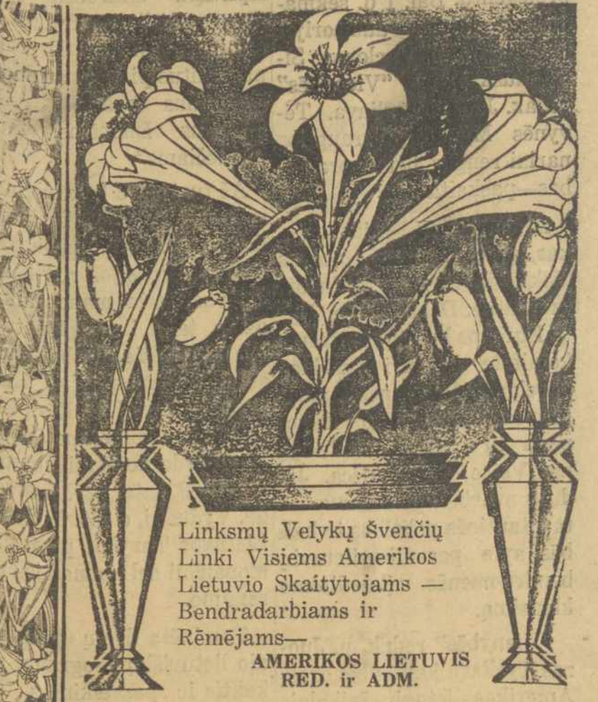
Linksmų Velykų Švenčių Linki Visiems Amerikos Lietuvis Skaitytojams — Bendradarbiams ir Rėmėjams — AMERIKOS LIETUVIS RED. ir ADM.

NEW YORK, kovo 22.—Šnipų byla New Yorke kasdien išsipleca ir vis naujų žinių surenkama apie jų veiklą. JAV labai tuo susirupino, nes ypač visokios delegacijos ir ambasados Sovietų esančios čia varo didelį šnipinėjimą Rusijos naudai. Saugumas ir slaptoji žvalgyba smarkiai pradėjo tirti neištikimus asmenis, kurie kursto darbininkus, bando daryti sabotazus. Amerika nori padaryti visai šiai veiklai galą visų griežtumu.