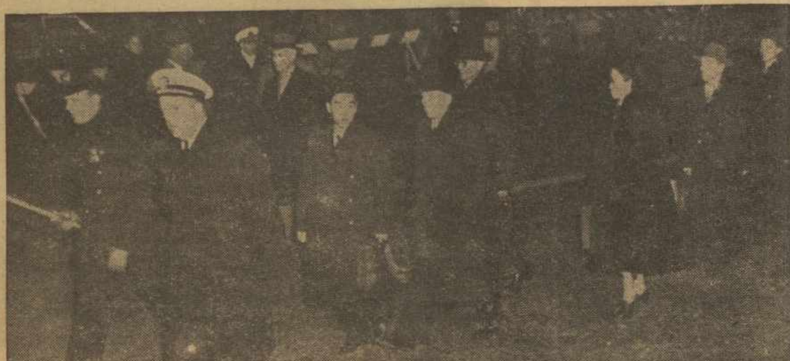
Kinijos Atstovai atvyksta į Jungtinių Tautų Sesiją

Darbas gėdos nedaro. Darbo šaknys karčios, Bet jo vaisiai saldūs. Į ką jaunas įprasi, tą senas teberasi. Tinginys ir kelią koją rodo. Tinginiui visuomet šventa. Visi nori mokėti, bet ne visi mokytis.