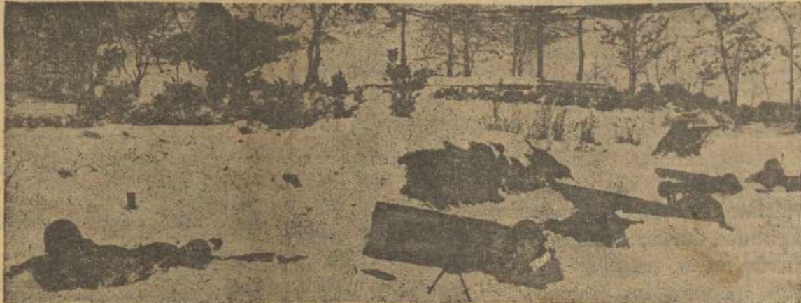
Jungtinų Tautų kareiviai gina savo pozicijas fronte Korėjoje.