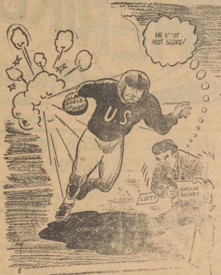
NETEISINGAI KAIK PAPERSTAI