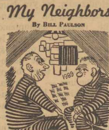
"If I had my druthers, I'd rather have an ounce of personal liberty and security than a ton of the horsefeathers called 'Collective Security!'"