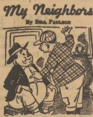
"Debt is just postponed work. With the national debt where it is now they'll have me chopping wood at the age of 269!"

Iki šiol Vakarų valstybių komunizmo atžvilgiu vesta pasyvi politika yra labai nuostolinga netik pavergtoms tautoms, bet ir joms pačioms, nes pareikalavusių iš jų aukų skaičius, neišvengiamame susiduriame su komunizmu, auga progresyviai sugaištam laikui. Ir net yra didelis pavojus, kad beprogresuojąs komunizmas netolimoje ateityje gali pasiekti prieš laisvąjį ir kultūringąjį pasaulį jėgos persvarą ir tuo pačiu galutinę pergalę. (galas)