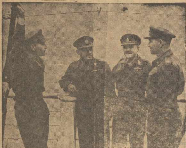
LAKUNAI iš "Skrendančių Cheetaks", Pietų Afrikos eskadrono atvyko į Korėją prisidėti prie Jungtinių Tautų jėgų.

Naujomis dudurimis aliejus iš Arabijos aliejaus šulinių gabenas į Viduržemių jūrą, arba kitomis dudurimis gali būti gabenamas į Persijos įlanką.