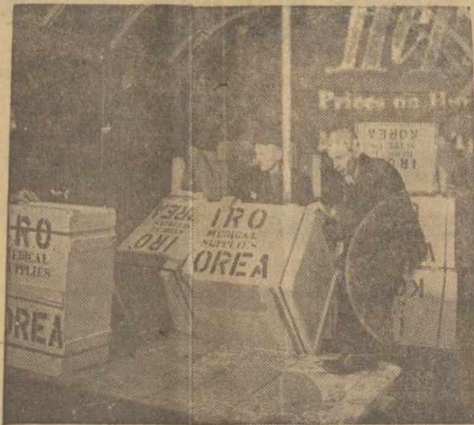
IRO SIUNČIA DRAŽIŲ APSAUGGTI KARO NUKENTĖJUSIUS ŽMONES N ATEINANČIOS ŽIEMOS ŠALČIU.

— ISJANLJAI tuoj pradės duoti paskolas per Eksperto-Importo banką, Amerikos vyriausybei davus leidimą.