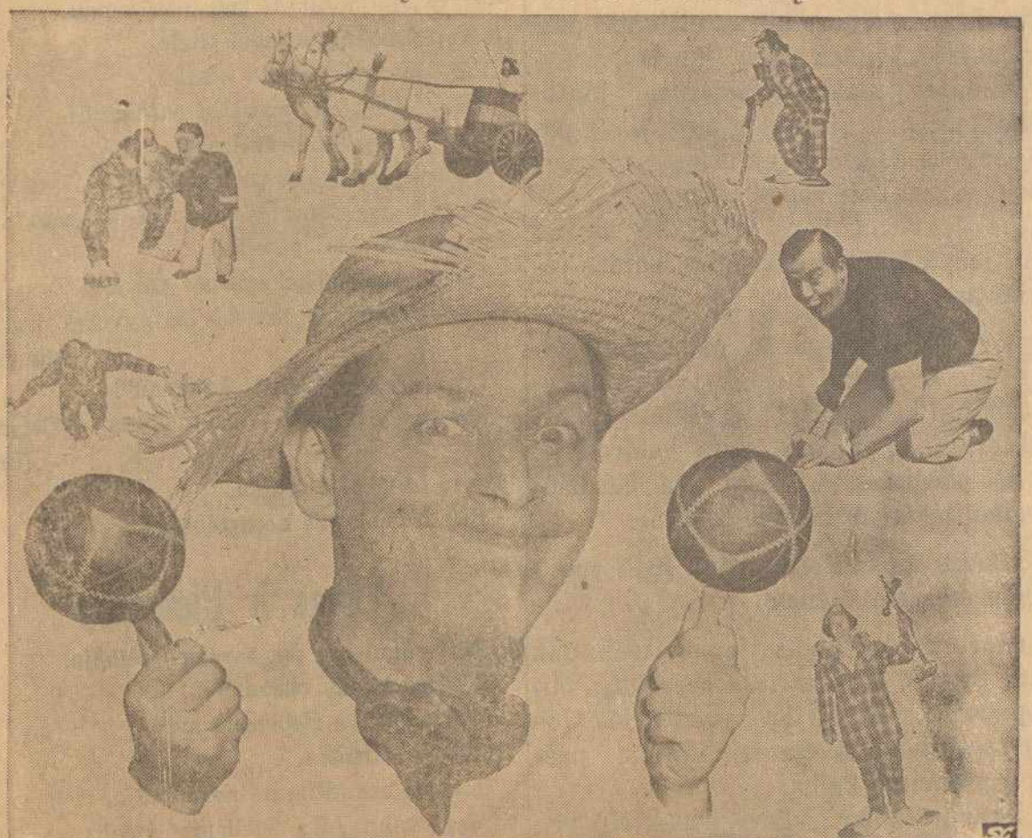
MILTON BERLE sugryžo šį mėnesį į šio krašto televizijos programą, su TEXACO STAR TEATRU.