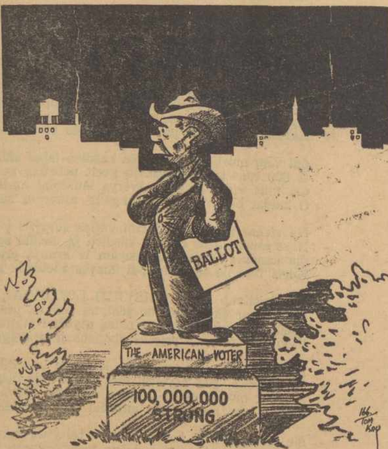
BALSUOTOJAS — Galingiausias žmogus Amerike