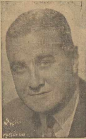
PAUL A. DEVER — I — Massachusetts Gubernatorius Pau A. Dever antrą kartą kandidatas į Massachusetts gubernatorius pareiškė, kad

jisai prieš šios valstijos balsuotojus gali padėti tokį rekordą, su kuriuo negali niekas susilyginti Massachusetts istorijoje. Jisai suteikė daug gero piliečiams laike savo dviejų metų tarnybos kaip gubernatorius. Jisai subalansavo biudžetą be pakėlimo jokių naujų taksų. Jisai pataisė senus kelius ir patiesė naujų. Piliečiai gavo pagerintas darbo sąlygas, geresnį sveikatos apsaugą, senesni gavo geresnį aprūpinimą, geresnes rekreacijos sąlygas, geresnes mokyklas ir geresnes progas užsidirbti pragyvenimą.