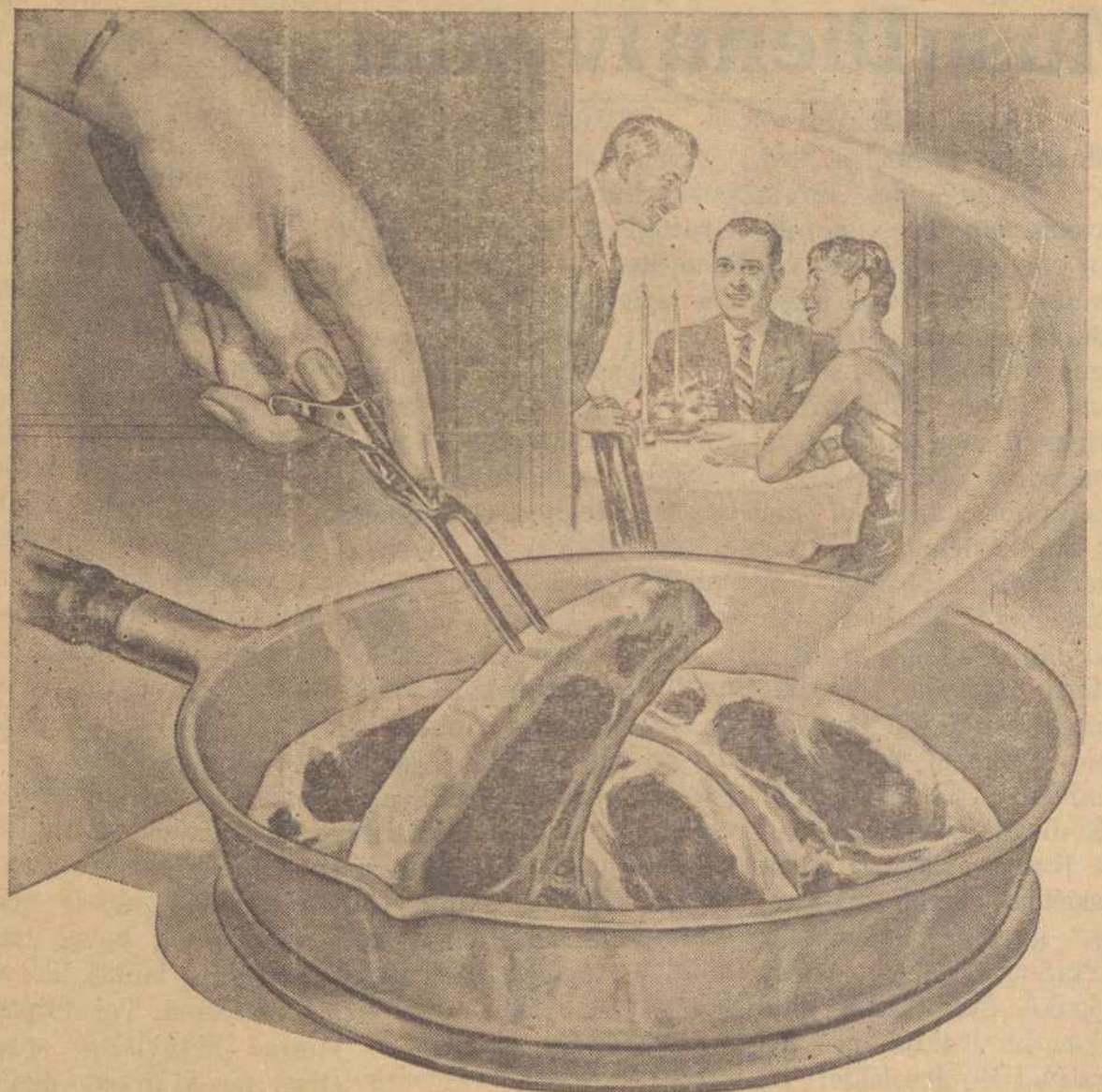
FOUR PORK CHOPS

Nėra galima apskaitliuoti naudas sekančias iš išmintingo žmoniško mokymo. Vaikas, kurs nebuvo mokytas nieko apie gailestingumą, nieką apie žmoniškumą, kurs niekuomet nesuprato, kad jis yra atsakomingas už silpesnių globojimą, užaugęs žiaurus ir bus taip pat negailestingas savo šeimynai ir artimui. Vienok vaikas, kurs buvo išmokytas supraci kaip Dievo žemesni sutvėrimai remiasi juo, kurio širdis atjautė pasigailejimo ir mielaširdystės, po jų įtaką užaugs buti geros širdies, narsus žmogus. Todėl reikia vaikus lavinti—jų rankas, jų protus, ir už vis svarbiausia, jų širdis. Išmokykite juos atjausti gyvunėlius, kurie yra mūsų pasigailejime, kurie negali išaiškinti savo silpnumą, savo skausmus, ar kentėjimus, ir tas tuojaus jiems duos suprasti tą aukštesnį įstatymą, tą morališką žmogaus pareigą, kaip aukštesnė butybė, apginti ir prižiūrėti silpnuosius. Ir čia nestos, nes iš eilės ves juos prie to aukščiausio įstatymo—žmogaus prievolė žmogui.