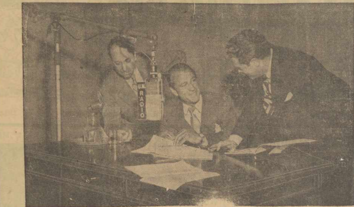
ZINIOS IŠ JUNGTINIŲ TAUTŲ veiki mo, netikiai naujuose namuose ir visose pasaulio dalyse bus praneštos žmonėms per radio ir per spaudą. Čia lošėjas Gary Cooper perduoda dramatišką veikalą del transliavimo per visą pasaulį per Jungtinių Tautų radio.