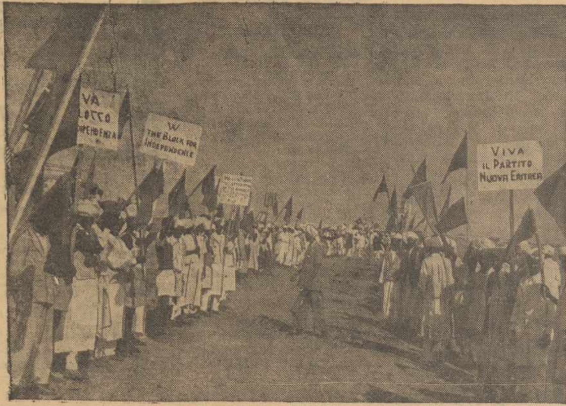
JUNGTINĖS TAUTOS yra susiartinę su pasaulio žmonėmis, dirbdami plačiai, netik savo naujuose namuose New Yorke. Paveiksle matyti kaip grupė Eritrėjo pareiškia savo reikalavimus atsilankusiem Jungtinių Tautų Komisijos atstovam.