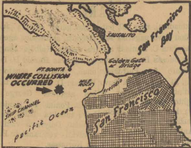
SAN FRANCISCO, CALIF.—Map shows the location of the sinking of the U. S. Naval hospital ship, Benevolence, after collision with the freighter Mary Luckenbach off the Golden Gate.