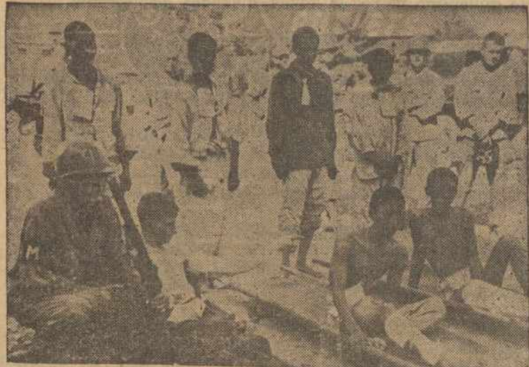
KUR NORS KORĖJŲ — Amerikos kareivis rodo į tuos šiaurės korėjiečius, kurie žiauriai ir sadistiškai kankino amerikiečius karo lauke.