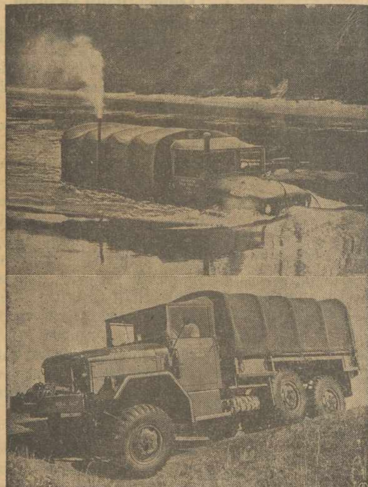
Reo Motorų dirbtuvė, Lansing, Michigan gavo kontraktą išdirbt 8,900 šių naujų sunkvežimų už $55,000,000. Sunkvežimas gali plaukti vandeny ir važuoti ant bile kioskios žemės.