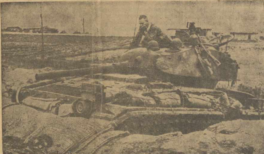
KUR NORS KOREJUJE. —Irodant faktą, kad kareivis praleidžia daugiau laiko laukdamas negu kovodamas, šis tankų vadas laukia žodžio, kada pradėti šaudyti, pagelbėti pėstininkams. Šis tankas įkastas naudojamas, kaip apsiginimo artilerija viejo savo paprastos judėjimo rolės.