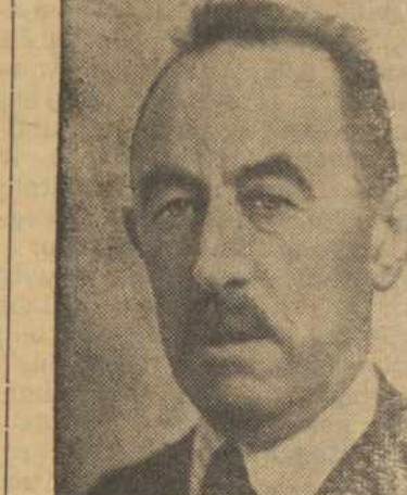
CAMILLE GUTT Tarptautinio Lėšų Fondo viršininkas, reiškiantis Suv. Tautų agentūrų svarbumą pasaulio ekonomijoje.