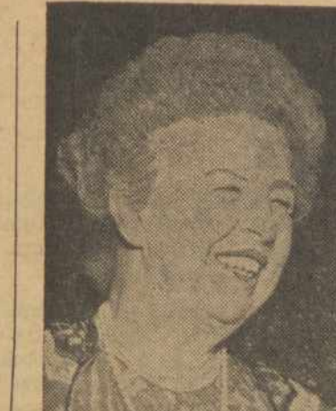
ELEANOR ROOSEVELT Svarbi figura Suv. Tautose, reiškianti moterų svarbumą pasauliniuose santykiuose.