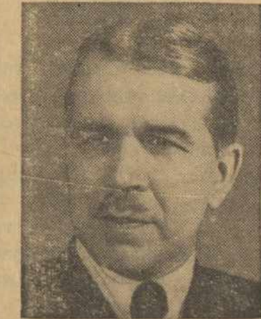
SERGEI VAVILOV Žymus sovietų mokslininkas, reiškiantis mokslo svarbią rolę, ypatingai atomiškos energijos—pasaulio politikoje.

Kaip tik vasaros metu galime rašyti apie Amerikos meną. Visur, šiame sezono, matome kaip amerikiečiai mėgsta muziką ir vaidinimus vasariniuose teatruose. Gal orkestros koncertas parke, gal beno muzika mieste, arba puikios simfoninės arba operetinės programos per radio ir beveik kiekviename name yra radio—duos rašytojui progos parašyti apie minias amerikiečių, kurie klauso savo mėgiamos muzikos, arba rašykite apie vaidinimus vasariniuose teatruose visoje šalyje, net mažiausiose apylinkėse, arba apie muzėjus ir kitas puikias viešas vietas. Atrodo, kad mums ne-