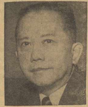
GEN. CARLOS P. ROMULO ... iš Filipinų, Suv. Tautų Asemblėjos prezidentas reiškiantis Tolimų Rytų kylantį svarbumą pasauly.