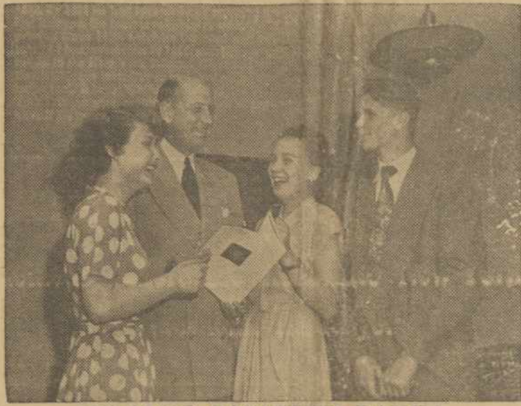
ATLANKĖ PASAULINĖ BANKĄ

Karo sekretorius Johnson paaikšino Kongresui kas buvo padaryta su 90 bilijonais dolerių, kuriuos Kongresas per 5 metus davė Amerikos karo reikalams. Pasirodo, tik 18-tas tų pinigų nušimtis buvo skirtas naujiems ginklams pirkti. Apie 42 bilijonai nuėjo išlyginti praėjusio karo skolas ir spragas. Pavyzdžiui, du bilijonai buvo išmokėti karo veteranams, kaip negautų atostogų pinigai. Apie 20 bilionų išėjo algoms, maistui ir kareivių drapanoms. Už devynius bilionus išlaikyta laivai, lėktuvai ir tvirtovės. Du bilionai skirti naujiems ginklams išrasti. Pasirodo, kad tikram apsiginklavimui, visgi, permaža pinigų išleista.