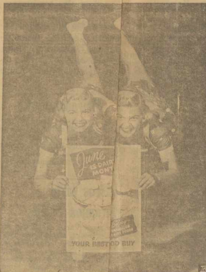
PIENININKYS'S MĖNESIS Šį mėnesį pienininkystės amonė minėja savo 14-tas metines sukaktuvės bendradarbiaut laikraščiams, žurnalams, radijo ir televizijos stotims, krautėm, viešbučiam, restoranam. Sios dvynekės, čiuzinėjimo žvaidės sako: "Mes sveikos, delto, kad mėgstame valgyti pieno produktus".

tų žmonių, kurie mokėtų daryti, nes niekas pasaulyje nebūtinai supranta nei vieno iš mūsų tautos reikalų. Nesupranta nei vieno iš mūsų tautos reikalų. Nesupranta nei vieno iš mūsų tautos reikalų. Nesupranta nei vieno iš mūsų tautos reikalų.