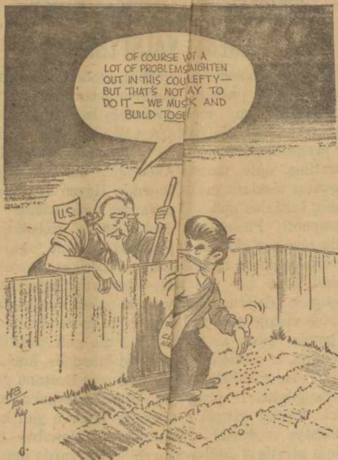
"KĄ ŽMOGUS SEJĄ IR PIAUNA. . . ."

Tą naktį buvo suimta 34,260 asmenų įvairaus lūmo ir užsiėmimo: pradedant nuo profesorių, mokslininkų ir baigiant paprastais ukininkais bei darbininkais. Iš vėliau rastų sąrašų paaiškėjo, kad buvo numatyta iš viso išgabenti apie 700,000 lietuvių, bet kilęs karas tarp vokiečių ir bolševikų sutrukdė. Tai liudniausia ir skaudžiausia Lietuvos Tautos gyvenimo diena. Kol kur nors bent vienas lietuvis bus, tol tą liudną dieną minės.