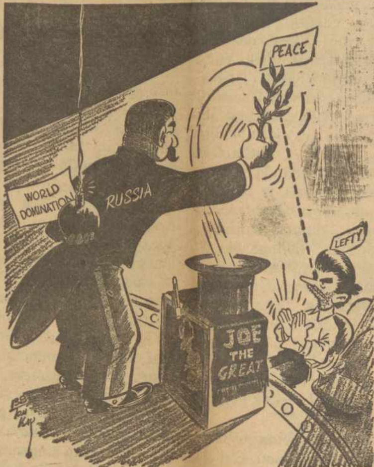
Watch Both Hands, Lefty