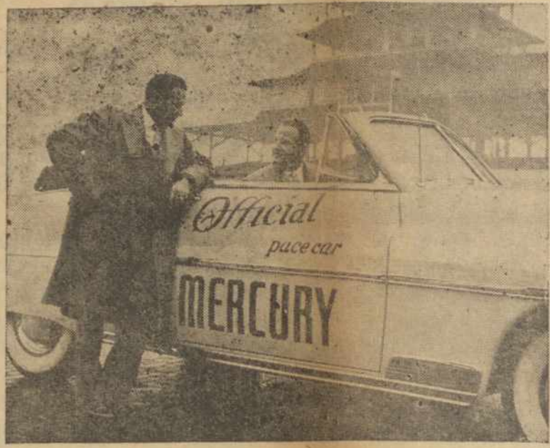
A stock Mercury convertible driven by Benson Ford (right), vice-president of Ford Motor Company and general manager of the Lincoln-Mercury division, will pace the 34th International 500-Mile Race at Indianapolis, May 30. Wilbur Shaw (left), three-time winner of the 500 mile race and now president and general manager of the Indianapolis Speedway, will ride with Mr. Ford as passenger. In announcing the selection of Mercury to pace this year's race, Mr. Shaw said that Mercury had made an important contribution to the advancement of the automotive industry in winning the recent Grand Canyon Economy run with the remarkable average of 26.52 ton miles per gallon of fuel.

"I would like to say on behalf of the United States that it is both unfortunate and inappropriate for the Soviet and, I gather, the