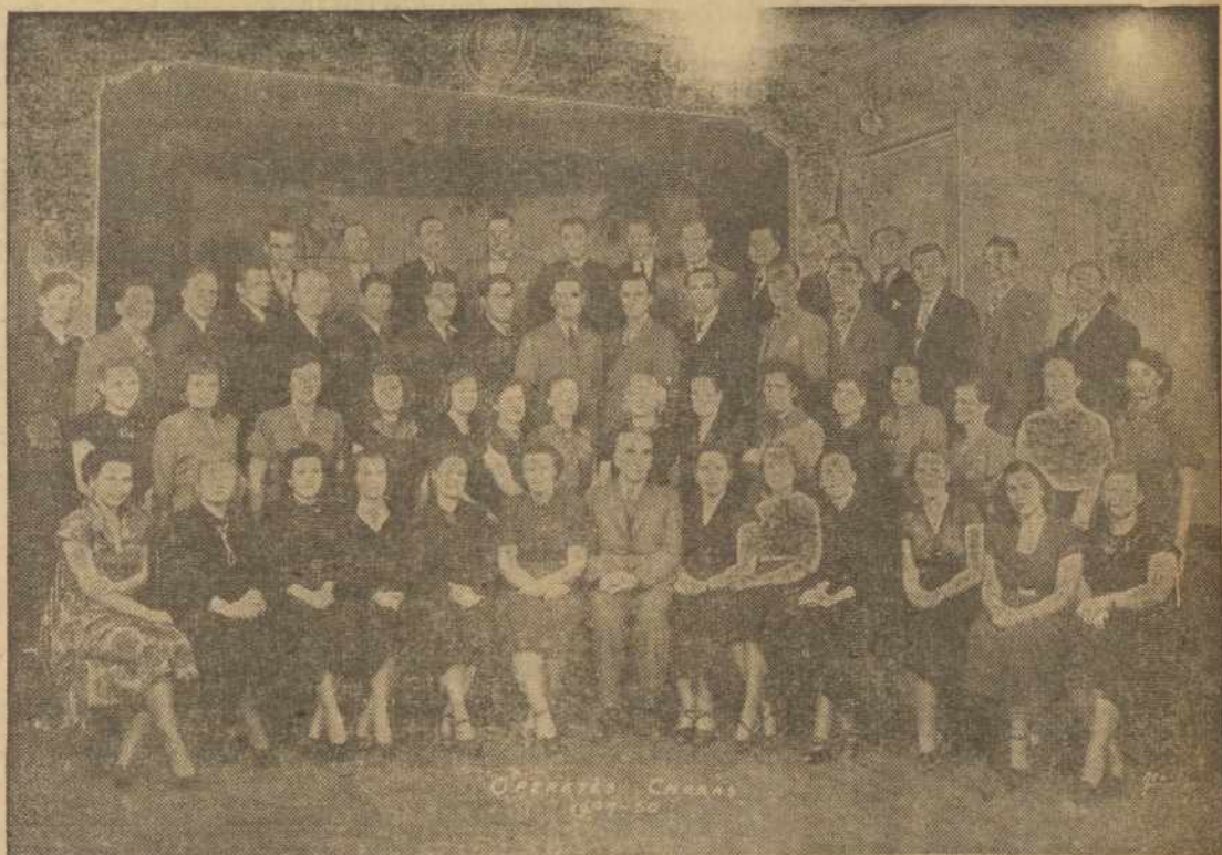
BROOKLYNO OPERETĖS CHORAS, švenčias 35 m. Jubiliejų