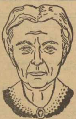
THE ELMO COMPANY DEPT. 565 DAVENPORT, IOWA

Try this simple home treatment. Many people have written us that it brought them blessed relief from the miseries of Hard of Hearing and Head Noises due to catarrh of the head. Many were past 70! For proof of these amazing results, write us today. Nothing to wear. Treatment used right in your own home—easy and simple.