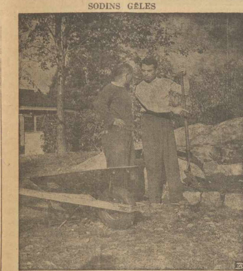
Jon Whitcomb, kurio piešiniai yra žinomi per visą pasaulį, ne tik artistiška piešia, bet ir tą savo gabumą pritaiko prie savo namų ir daržų užlaikymo. Ponas Whitcomb su daržininku planuoja, kur sodinti gėlių daržus.