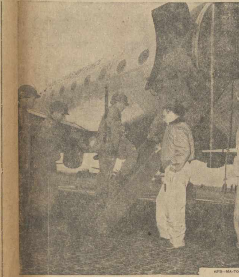
LEKTUVAS VEŽA SKIRTINGĄ KROVINĮ

Amerikos apdraudos kompanijų tyrinėjimai rodo, kad moterys moka geriau daiktus pirkti, negu vyrai. Moterys net vyrams drapanų geriau nuperka.