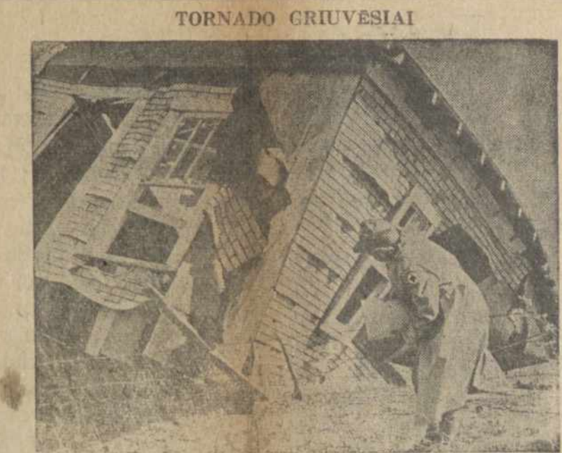
Raudonojo Kryžiaus pastatų darbininkas patikrina namą, kuris buvo pažeistas Arkansos Tornado. Šis namas tik 4 mėnesiai ką buvo užbaigtas prieš audrą. Raudonasis Kryžius pagalbsti jį atstatyti.