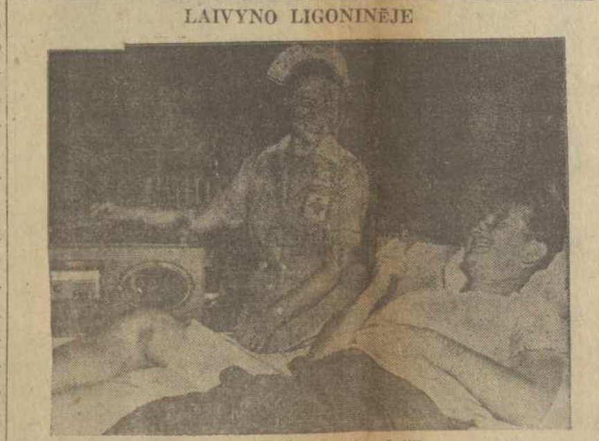
Laivyno ligininės liginis užrekorduoja laišką savo tėvams su pagelba R. Kryžiaus slaugės.

IZRAELIO valdžia paskelbė planą kuris padarytų kraštą valstybe su pustrėčio milijono gyventojų žydų.