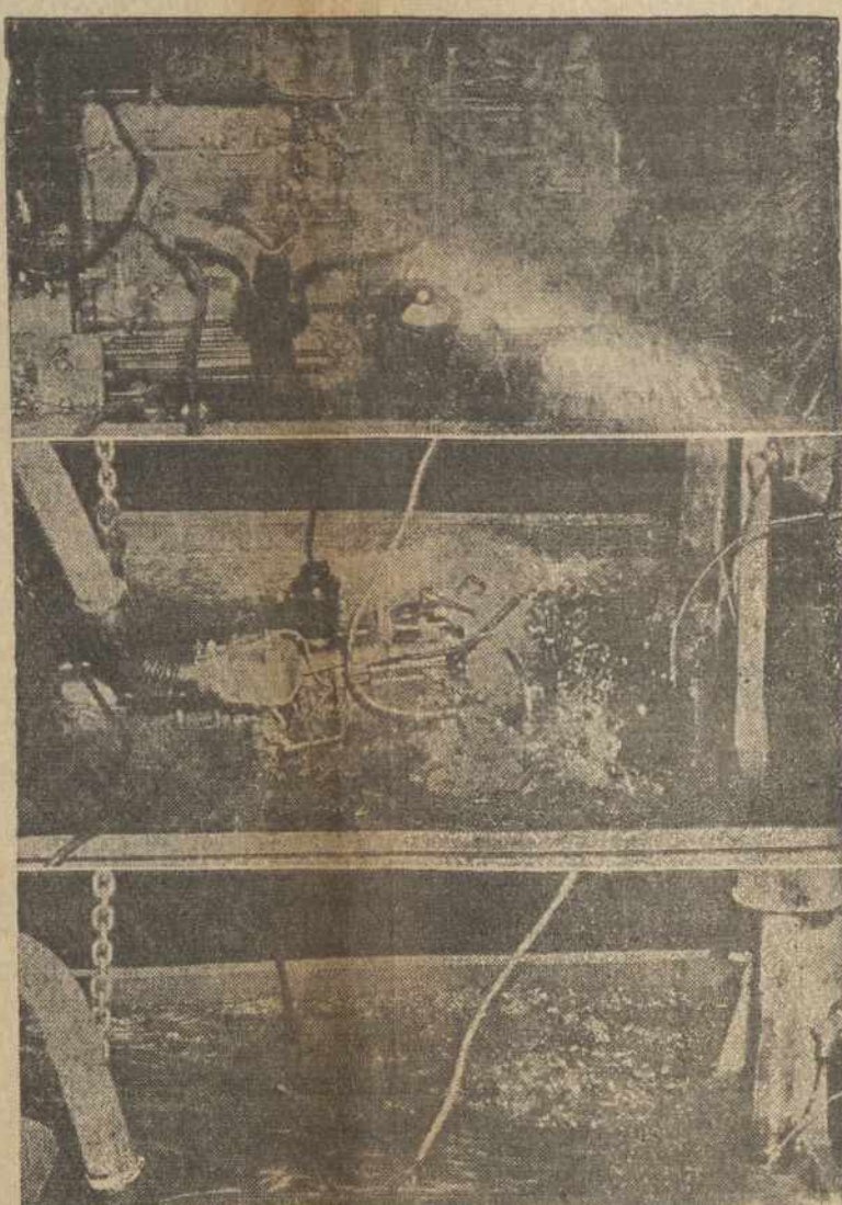
Naujas $3,500.00 Reo Gold Coronet gasolino inžinas gali netik pavilkti sunkvežimį, bet ir nebijo nei vandens.

kurią turi sudaryti savosios kalbos mylėtojai. Ir kuo jų bus daugiau, tuo bus geriau.