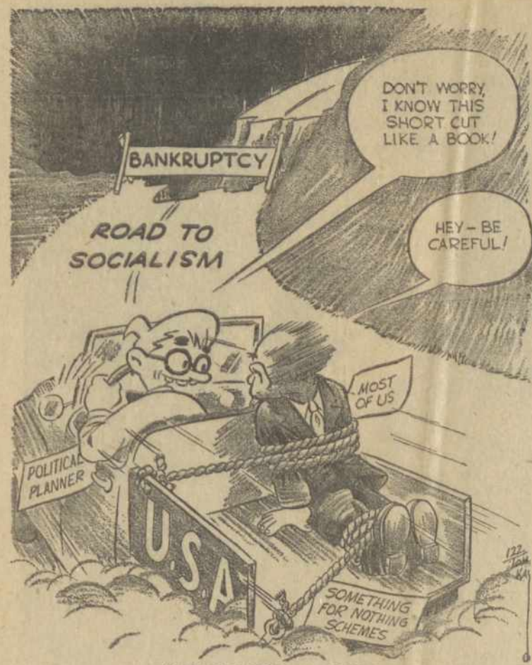
TAKEN FOR A RIDE